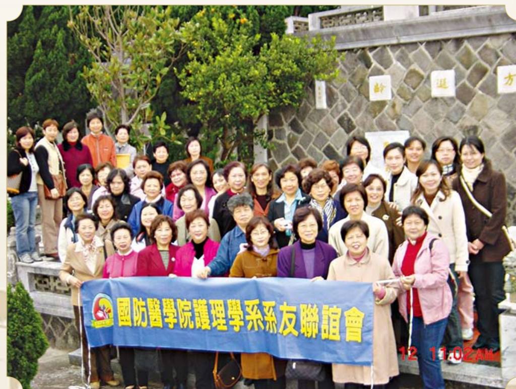
● 護理系友每年均舉辦春祭周美玉將軍活動