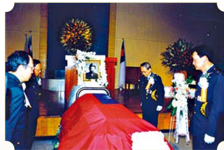
● 周將軍一生為國為護理努力奉命以國禮悼祭

周主任於2001年3月13日病逝於三軍總醫院，享壽92歲。為紀念中華民國護理之導航先師，系友會於每年清明節前均會主動邀集系友參與周美玉將軍的年度祭祀典禮，以表達各界對他的追思與感念。期盼系友們持續秉持慎終追遠、飲水思源的精神永懷恩師---周美玉將軍，藉由軍護之母凝聚系友們的向心力，支持護理學系與系友會永續經營！