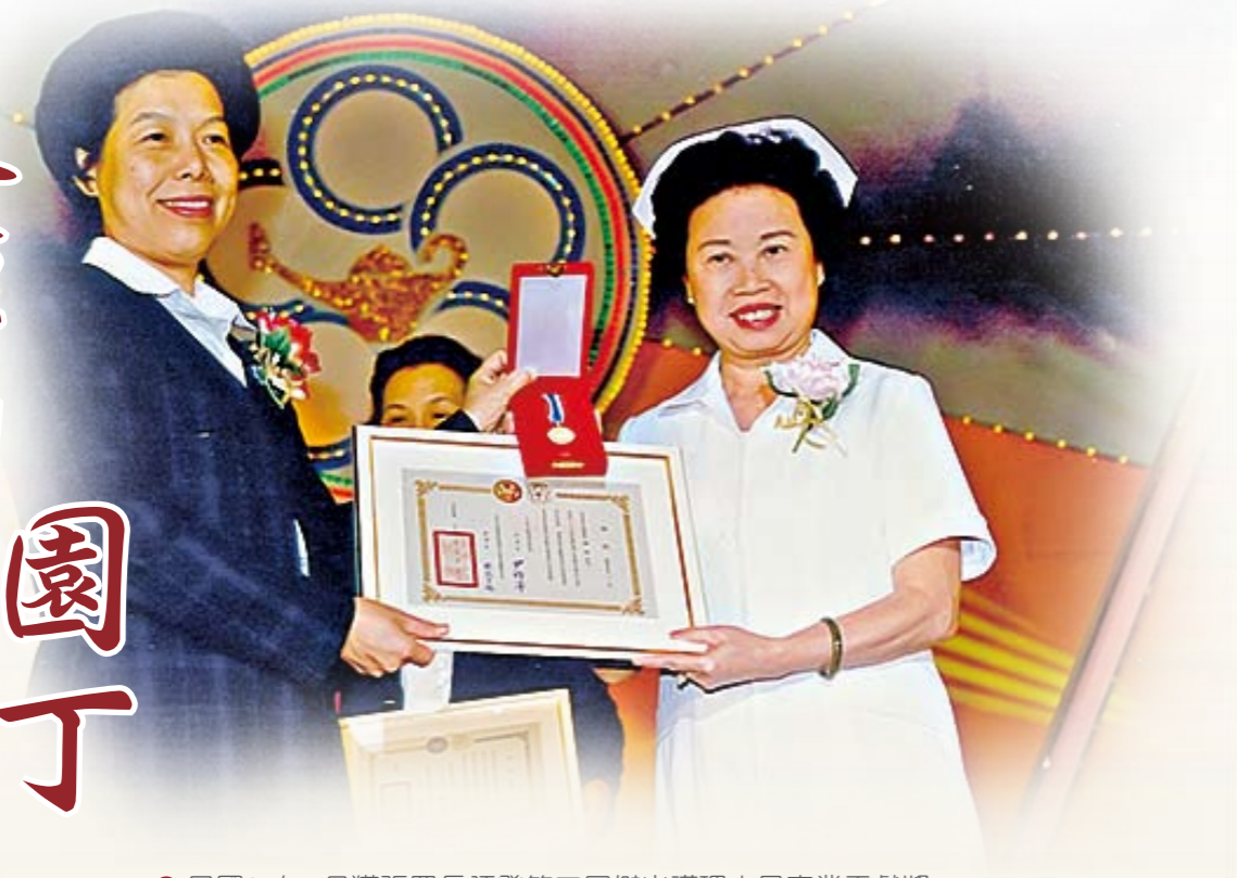
● 民國85年5月獲張署長頒發第三屆傑出護理人員專業貢獻獎

時間過得好快，轉眼已畢業五十年了！看著一冊一冊的照片簿，好似流水記憶，實則是我生命（事業和家庭）悸動的紀錄。