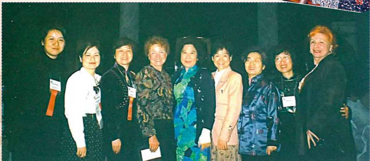
● 以台灣STT理事長身份出席1997年(75週年)年會，與理事長合影