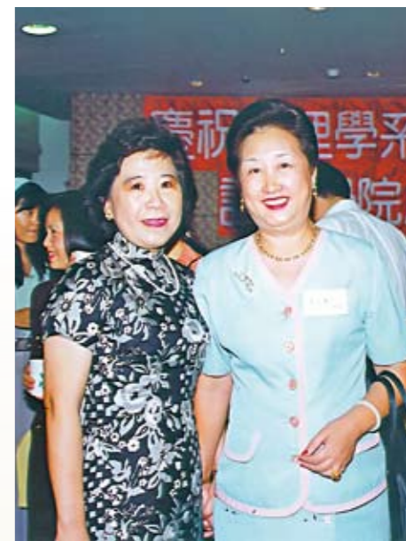
● 陽明護理學系十週年，護理學院成立

夏教官在所有國防醫學院護理學系同學的印象裡始終都是這麼溫柔美麗典雅端莊，上課內容精彩學生聽得入神，下課身旁總圍繞著一圈「粉絲」，她的氣質自是與出身書香世家有關，1948年她就從上海隨官居要職的父親來台，母親優雅賢慧常以詩畫自娛，很早就教她讀書識字，夏教官天資聰穎，5歲就入小學且一路名列前茅，還曾以榜首考進彰化女中，別人以讀書為苦，她卻樂在其中，熟讀教科書不是難事，博覽群籍尤其是中外名著更是廢寢忘食，當然薰染得一筆好文采還曾一度想以作家為業。