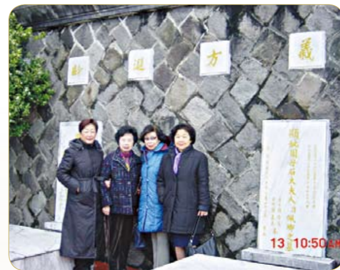
● 每年必定由高雄北上參加春祭恩師周美玉將軍活動

民國89年後，我覺得年事已老，不能老是把自己沈浸在寂寞和悲哀裡！心想忙碌了一生，應該趁身體硬朗時享受些人生吧！於是開始出國旅遊，至今已暢遊51次，足跡遍佈歐、亞、非世界各地，尤其是對祖國河山，白山黑水，駝鈴雁陣，無限風光令人陶醉。也許由於身體尚好，膽子夠大，70多歲的我仍敢參加拖曳傘、熱氣球、香蕉船、浮潛、騎駱駝等活動，真所謂人生不留白，用心去體驗！