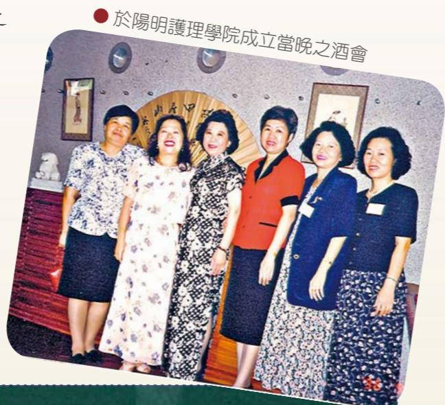
● 於陽明護理學院成立當晚之酒會

我們勇敢的「都市女冒險家」並未因退休而閒散，她開始作空中飛人，搭了4年飛機來回為長榮大學護理學系奠定根基，2003至2005年間她榮膺國防醫學院護理學系系友聯誼會會長，凡事認真的她，不因聯誼會是民間社團而鬆懈，她帶領學妹以嚴格的品質要求，共同完成彙編『我們的恩師軍護之母周美玉將軍』紀念專輯、恢復發行護理學系系友聯誼會會訊、於ICN大會設置軍護展示館及發行源遠護理雜誌等不可能的任務。民間社團最難的就是人力與財力的募集，系友聯誼會這些不可能的任務都在夏院長出錢出力的感召下奮力完成，卸下會長職務，她又榮膺系友會的常務監事，受學妹重託續任『源遠護理』的發行人，因為我們讚賞她的溫柔，更服膺她勇敢而堅持的帶領。