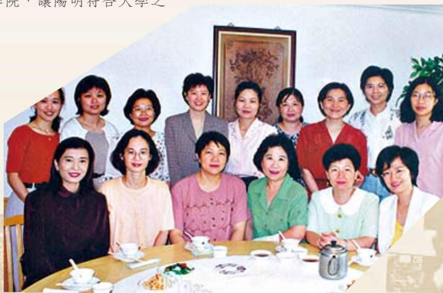
● 為籌組護理學院系友會，宴請歷屆畢業生代表

(2) 『可以勇敢也可以溫柔』1991年天下文化出版，由旁氏公司(Chesbrough-Pond's)首位女性副總裁史克羅所著。