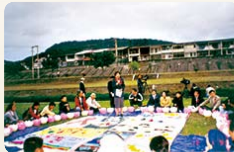
●聚集群眾縫製愛滋床單

護理界有在中華民國護理事長及理監見、全體護下，擔任台灣公會理事長的開辦園遊會、及募款，登高商、醫療、護台幣1,000萬元國84年5月成立護理人員愛滋病