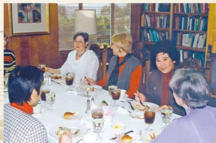
● 訪問universifg & San Diego大學，研擬暑期進修計畫

1996年陽明大學護理學院終於成立，護理教育學制從此跨入一個新紀元，有了前人披荊斬棘，後繼的護理學院成立自是順