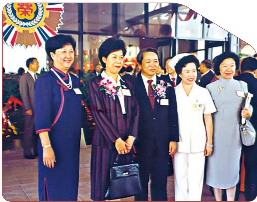
● 民國79年10月31日高雄分院開幕典禮，張署長、鄭院長、台北榮總王主任、台中榮總曾主任合影

每週一、二、三日在台中榮總上班，四、五、六日去台北榮總上班，辛勞艱苦，固不在話下，但我能獲得台中、台北榮總護理部的全力支援、配合，並給我精神上莫大的鼓勵！民國79年6月，我奉命率領第一批前鋒部隊南下高雄進駐奠基，開發新世界！台北榮民總醫院高雄分院十月開幕，護理部一切作業進行良好。