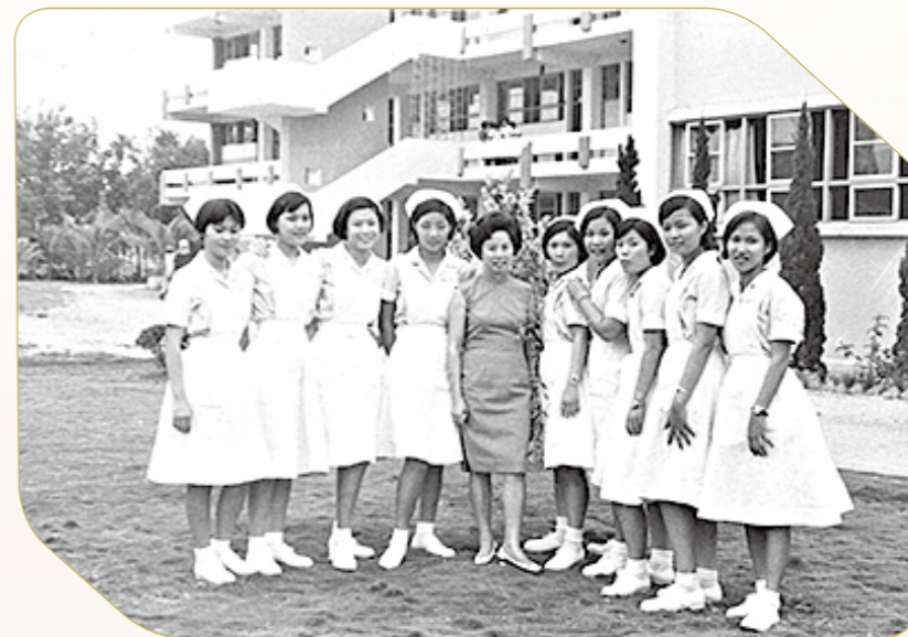
● 民國60年與美和第一屆畢業生合影

民國58年官拜中校奉准退伍，隨即轉換跑道，應聘於屏東私立美和護理專科學校，專任護理科主任，我專心一意的呵護著一顆顆的幼苗，灌溉成紅潤突出的護理專業果實，從春天到秋天。