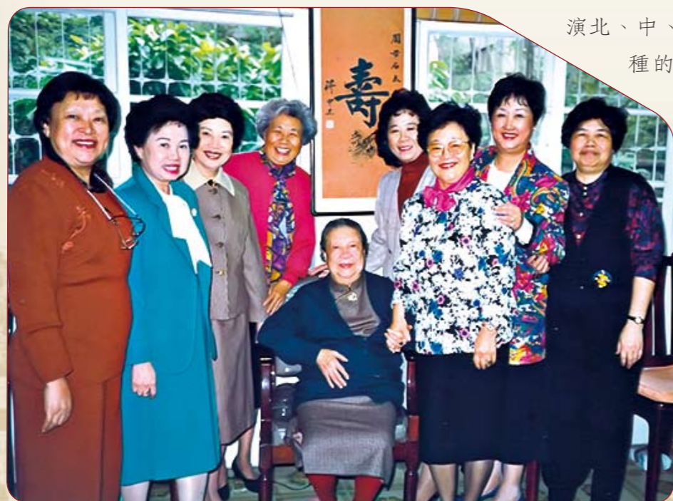
● 民國82年參加周主任生日慶祝會

在高雄榮總工作8年的日子裡，伴隨著醫院的成長，從分院晉級為總院，甚而評鑑審定為醫學中心。每日護理工作除掌控、指揮外，更需與院方各部門進行溝通、協調、支援與疏解，真可謂日理萬機，鞠躬盡瘁，無時或已。但我一切均秉持和為貴，謙沖為本，服務為目的，助人為本分，故8年的護理主任工作，領導統御，奉公守法，嚴以律己，寬以待人，總算圓滿達成任務。扮演北、中、南榮民總醫院力耕火種的園丁功成身退，民國87年2月我退休了！