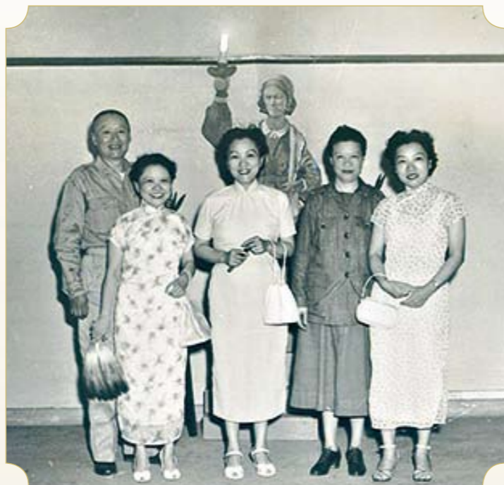
● 護理示教室南丁格爾女士像前

1958年晉升為全國首位女性陸軍軍醫少將；於1972年屆齡退役，續聘為國防醫學院教授兼護理學系系主任，同時亦擔任榮民總醫院創院之護理部主任並協助釐定各項作業制度以迄退休，培養之護理人才堪稱桃李滿天下，今多為社會中堅，教育界之菁英、醫護主管，尤其各軍醫院及榮民醫院之臨床護理及行政領導職務更以其門生為主力，譽為『軍護之母』確是實至名歸。綜計其服務軍職及為退除役官兵醫療事業效力逾40年，功績卓著先後在軍中獲頒無數勳獎章，另行政院衛生署以其提升護理教育水準授予二等衛生獎章，此外，並獲美國自由獎章一座，1990年獲得第十屆醫療奉獻獎等。