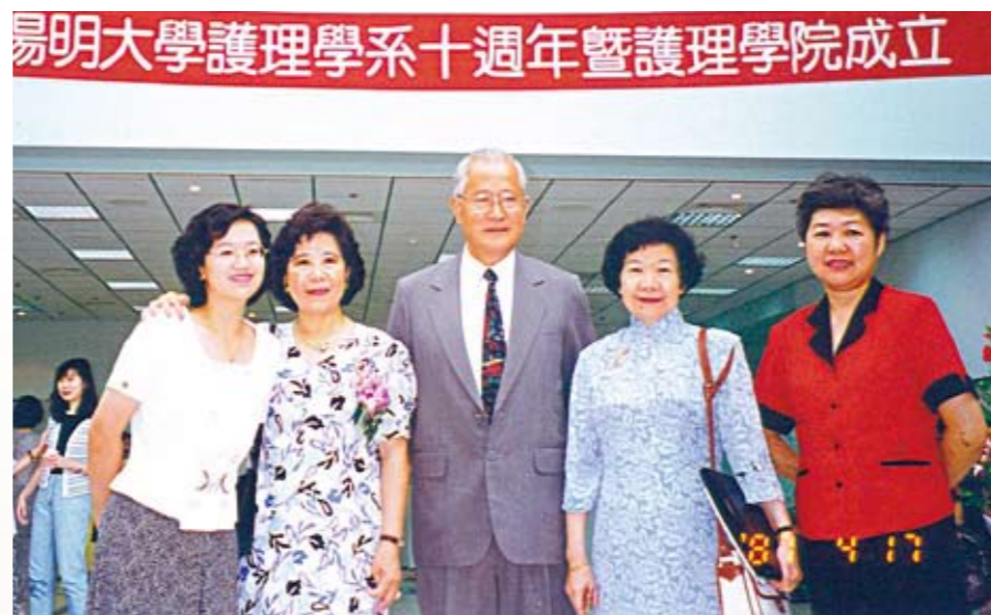
● 陽明大學護理學院終於成立了

基本設置升等為大學，醫學院、生命科學院及醫事技術學院同時獲准成立，經夏教官不斷努力已有二系二所的護理學系卻獨排於外。