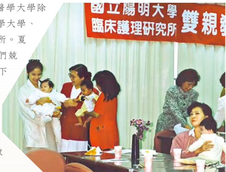
● 創設雙親教室，免費為孕婦及家人做產檢及衛教

暢許多，目前國內設有護理學院的醫學大學除陽明外已有高雄醫學大學、台北醫學大學、中山醫學大學及輔英科技大學等共5所。夏院長及她的團隊並不以此自滿，她們兢兢業業持續努力，以成立博士班為下一階段目標，期望為護理學術再創高峰，一切將就緒時，全國第一位護理學院院長夏萍緬教授任期屆滿功成身退，在2000年從陽明大學光榮退休，退休茶會上長官、部屬、教師、學生人人皆感恩與不捨。